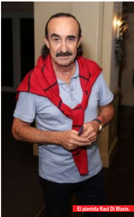
El pianista Raul Di Blasio.